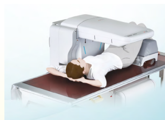
股関節(大腿骨)の検査